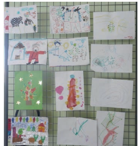
Les réalisations du concours 2013 sur le thème du « Pays du Père Noël »