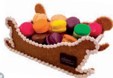
Traîneau de macarons