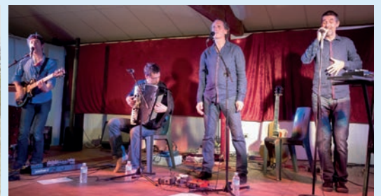
Commando Nougaro (14 novembre) devant plus de 80 spectateurs