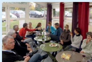
Rando d'automne (23 novembre) : effort sous le vent d'autan... puis réconfort autour du Gaillac nouveau (avec modération) !