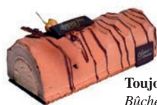
Toujours Bûche chocolat