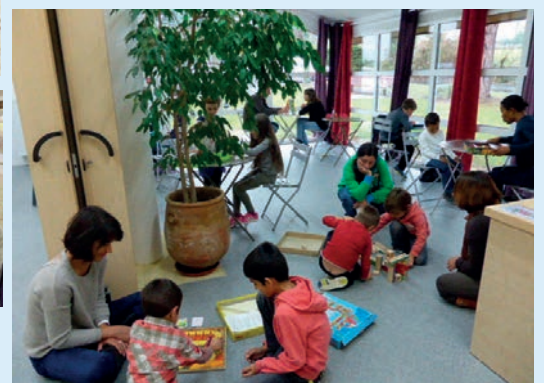
Après-midi jeux (30 novembre)