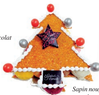
Sapin nougatine et sorbets